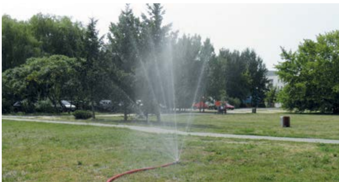
Upalne lato można spędzić nie tylko przy kurtynie wodnej.

Lato 2015 w klubie Progresja (ul. Fort Wola 22) będzie obfitować w prawdziwe muzyczne emocje. Na scenie zagrają między innymi Hirax (13 lipca), Steel Habit (13 lip-