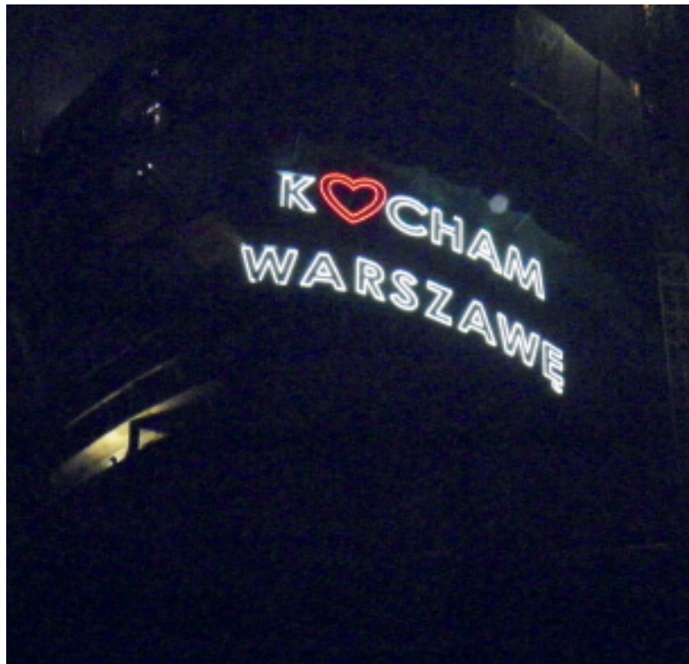
Neon „Kocham Warszawę” z Warsaw Spire na Woli

Miłośnicy neonów mają jednak powód do zadowolenia. W ostatnich latach ponownie powróciły do łask i znów docenia się ich artystyczną wartość. Scena na Woli im. Tadeusza Łomnickiego może pochwalić się neonem zaprojektowanym przez Studio Bakalie. W ubiegłym roku został także odsłonięty neon „Wola oddycha” zlokalizowany na budynku wolskiego ratusza przy al. Solidarności. Ideą konstrukcji jest upamiętnienie powstania warszawskiego.